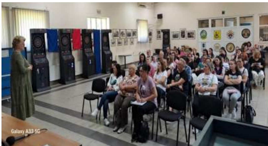
Prvi dan edukacije asistenata u Sl. Brodu

Dosadašnji i novi korisnici upoznati su s uvjetima pružanja usluge, obvezama, sudjelovanjem u izboru asistenata te prednostima i nedostacima zakonskih odredbi. Poteškoće pronalaska asistenata zbog potrebnog osposobljavanja su izazov, posebno za umirovljenike.