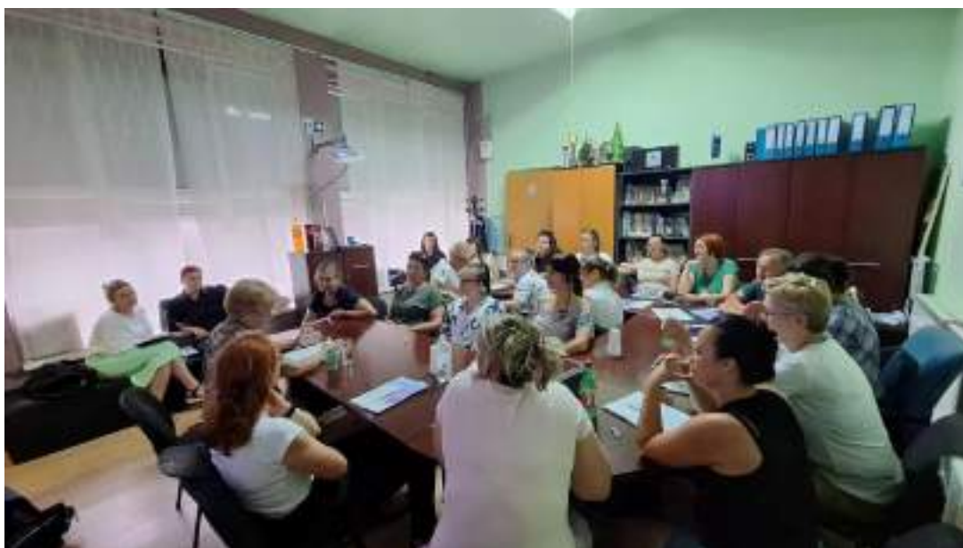
Treći dan edukacije u Sl. Brodu