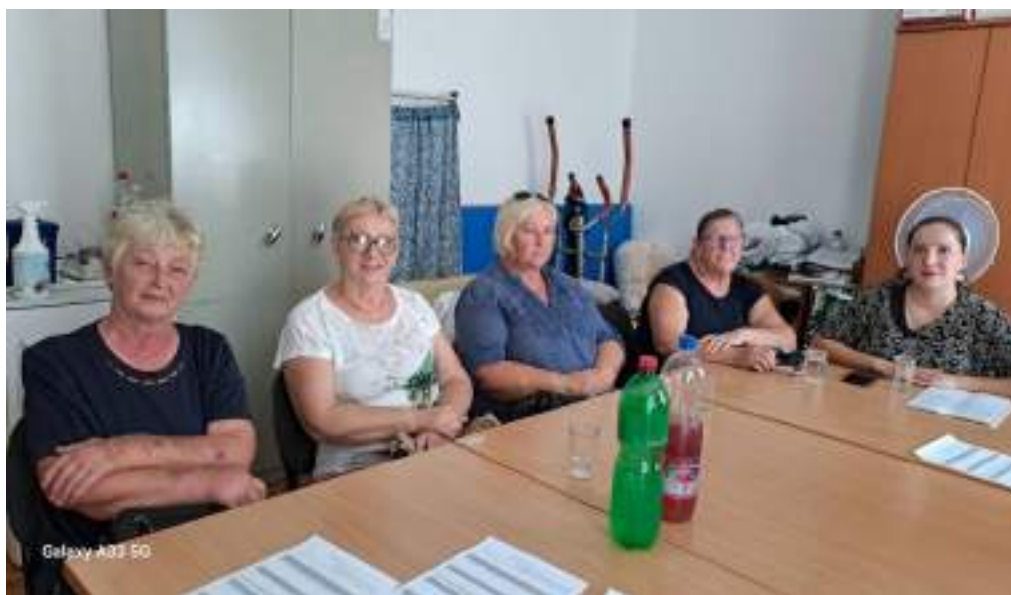
Sastanak s asistentima u Klubu Društva Nova Gradiška, 2. rujna