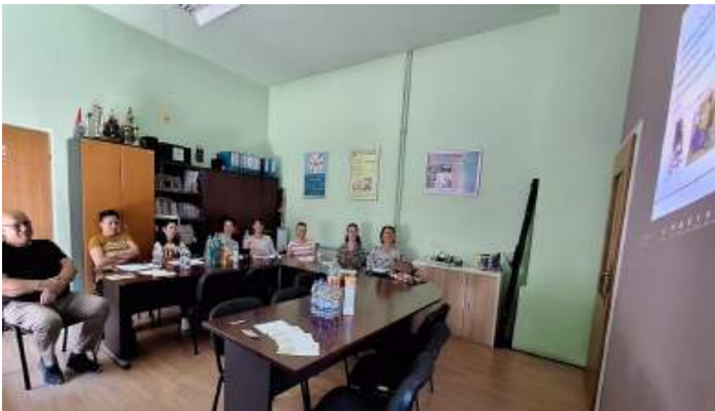
2. dan, online edukacija u Sl. Brodu