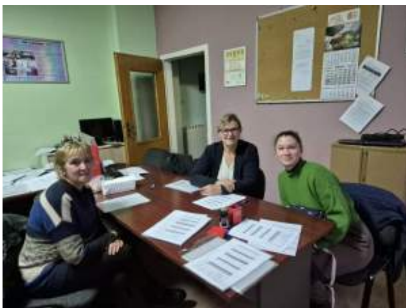
Sastanak s novim asistenticama u sjedištu udruge u Slavonskom Brodu, 27. studenog

Radi što boljeg pružanja usluge osobne asistencije, u udruzi su se održavali sastanci s novim, ali i sa starim osobnim asistentima, kako bi ih se upoznalo sa Zakonom o osobnoj asistenciji, odnosu prema korisnicima, njihovim obvezama kao zaposlenika, izvještavanju, osposobljavanju za poslove osobne asistencije i svemu ostalome što je bitno za pružanje kvalitetne usluge korisnicima i njihov rad.