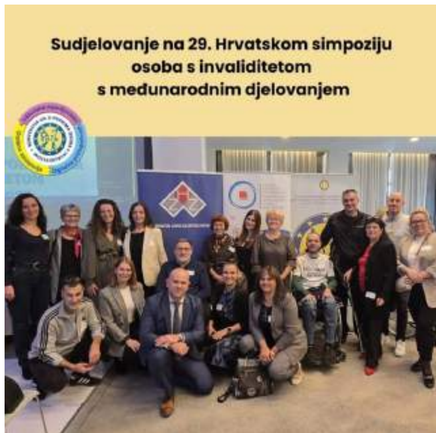
MS ekipa na Simpoziju