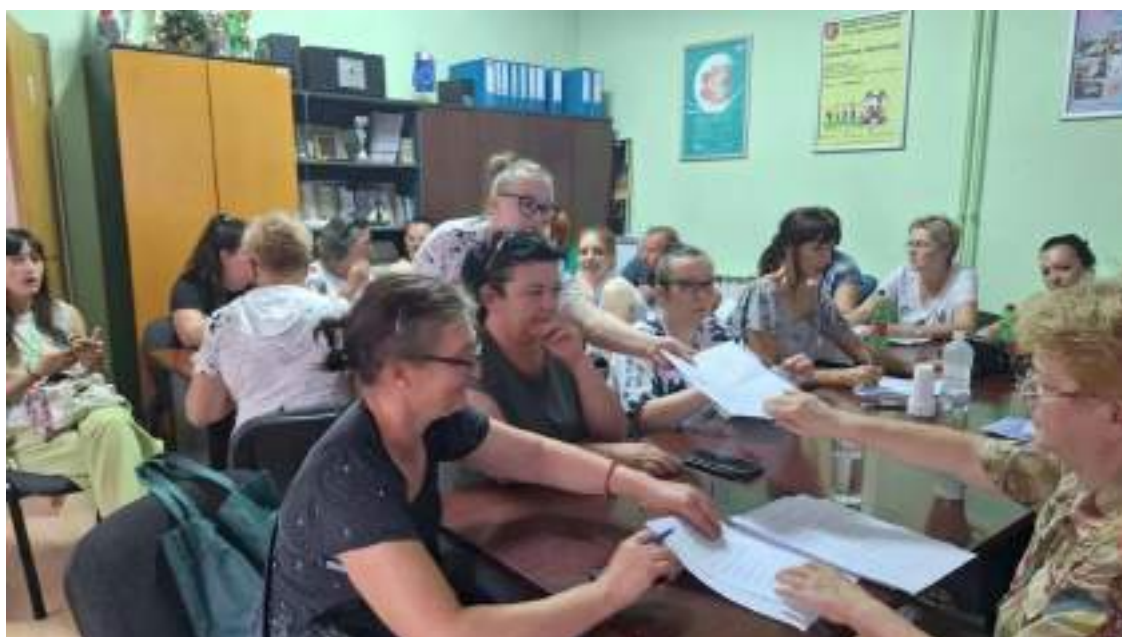
Polaganje ispita u Sl. Brodu